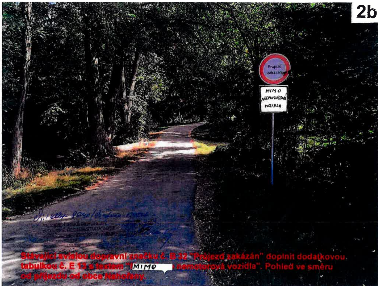
Stávající svislou dopravní značku č. B 32 "Průjezd zakázán" doplnit dodatkovou tabulkou č. E 13 s textem "MIMO nemotorová vozidla". Pohled ve směru od příjezdu od obce Haholany.